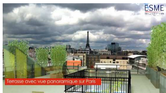
Terrasse avec vue panoramique sur Paris