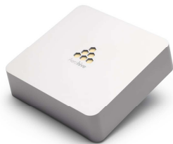
Borne WiFi AEROHIVE HiveAP120

En quelques heures les 600 congressistes arrivent à l'hôtel et se connectent tous en WiFi avec leur iPad fournit spécialement pour suivre ce séminaire zéro papier. Le défi a été relevé à la grande satisfaction du client.